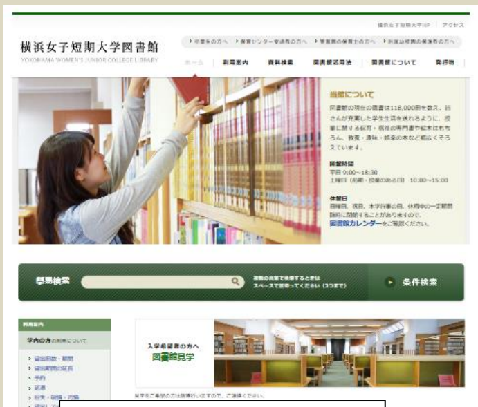
HP わからないことがあったら図書館へ

実習の心強い味方 H.A 私は、実習前や課題の調べものをする時に図書館を利用しました。実習にはいつも 15~20 冊くらい、絵本や紙芝居を借りて準備しました。実習期間中は、本がたくさん必要なので、いつもより多く借りることができるのはとても便利です。 図書館には様々な本があるので、探すことが難しいと思っていましたが、司書の方に聞くと、見つけ方のアドバイスをもらえるのでとても心強かったです。 (2018 年卒業)