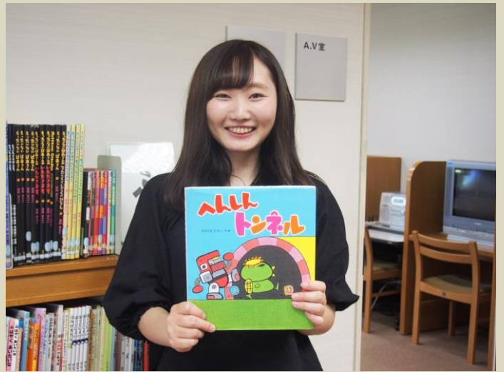
絵本・ブックトーク 私のお気に入りをおみんなに紹介