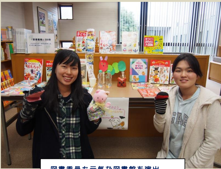
図書委員も元気な図書館を演出 オープンキャンパスの展示を担当