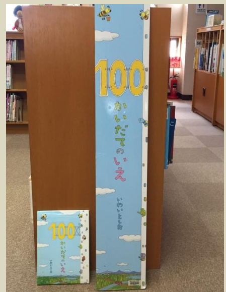
迫力ある大型絵本