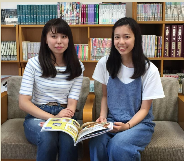
一日一回図書館へ くつろげる空間で休み時間に気分転換