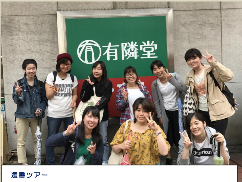
選書ツアー 図書館員と本屋さんへ、みんなに読んでほしい本を選びました

当館では、幼児教育・保育、児童福祉などの専門書を中心に、図書約 12 万冊、現行受入雑誌 105 タイトルなどを所蔵。絵本 9 千冊、紙芝居 3 千点で実習をサポート。