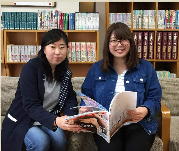
一日一回図書館へ くつろげる空間で休み時間に気分転換