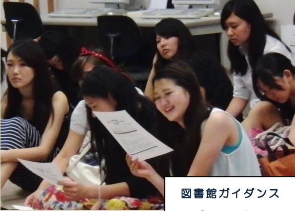
図書館ガイダンス レポート課題も、これでばっちり