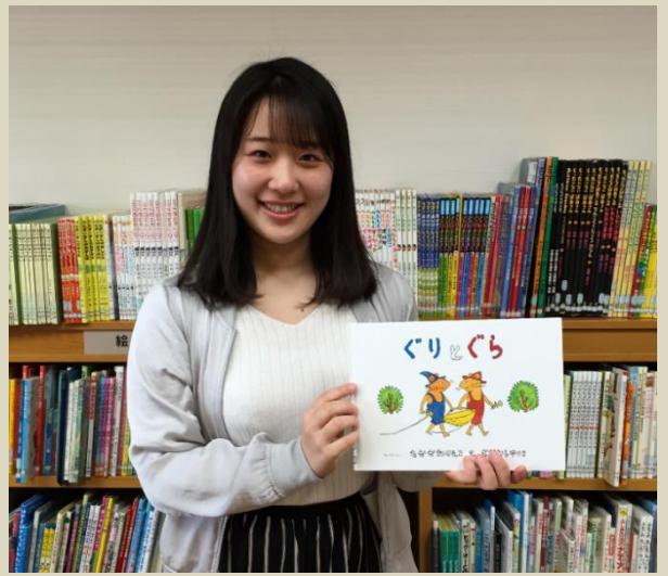
私の好きな絵本 実習の読み聞かせて子どもたちに人気