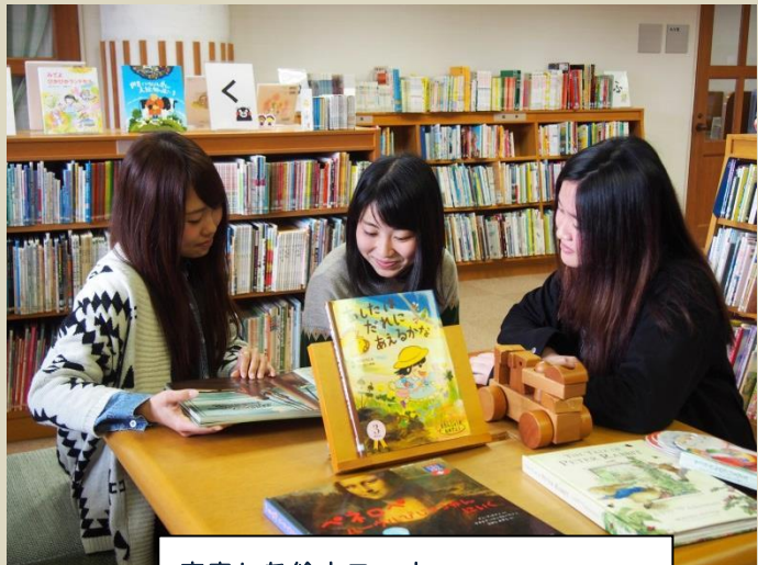
充実した絵本コーナー 子どもの頃に読んだ懐かしい絵本も