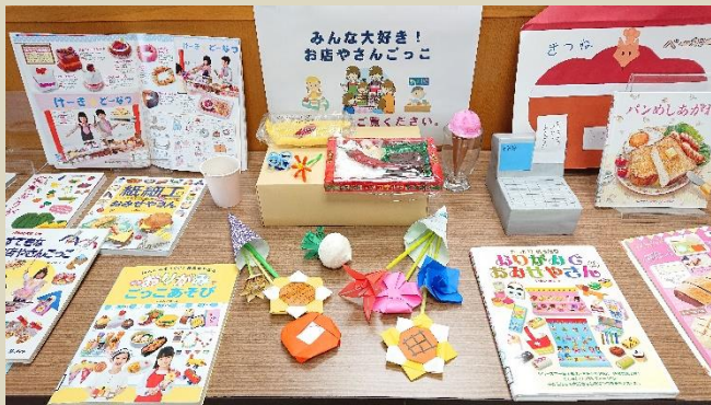
図書委員も元気な図書館を演出 オープンキャンパスの展示を担当