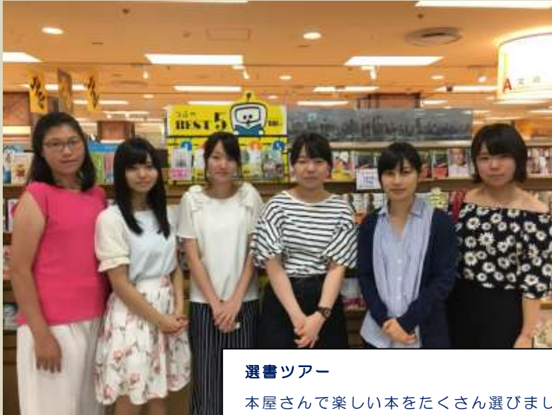
選書ツアー 本屋さんで楽しい本をたくさん選びました