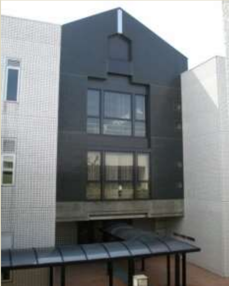
HP わからないことがあったら図書館へ

事前の準備をしっかりと T.M 実習で、初めて乳児と関わることになるのは 1 年生の 2 月の保育実習です。私がおすすめしたい乳児向けの絵本は、同じ言葉が何度も繰り返されて、リズムで楽しめるものです。小さい子どもたちにとっても喜ばれました。 それぞれの年齢にあう絵本を探すには、図書館の充実した絵本コーナーが便利です。実習前には絵本のほか紙芝居なども多めに用意しました。事前に読み聞かせや手遊びの練習をして、しっかり準備することでより充実した実習になります。 (2017 年卒業)