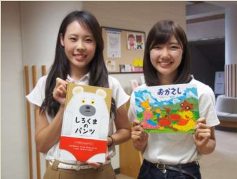
実習で人気の絵本 読み聞かせにどうぞ、きっと喜ばれます