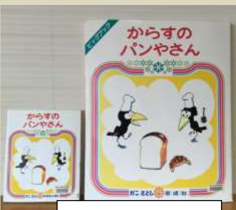
迫力ある大型絵本