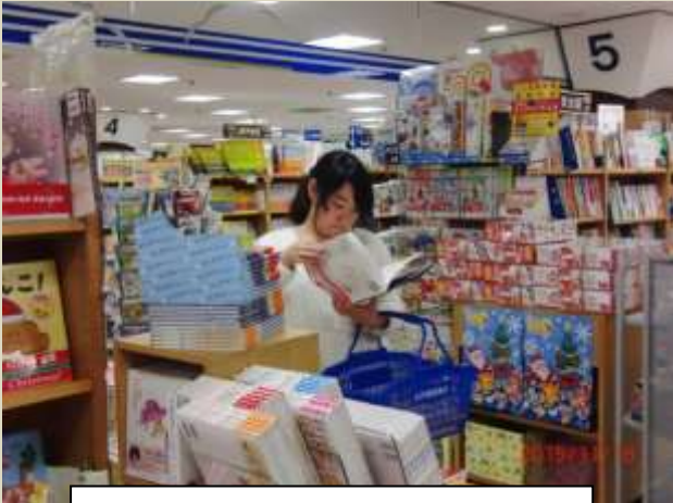
本の森で いつのまにか夢中になって

当館では、幼児教育・保育、児童福祉などの専門書を中心に、図書約 12 万冊、現行受入雑誌 104 タイトルなどを所蔵。絵本 9 千冊、紙芝居 2 千点で実習をサポート。