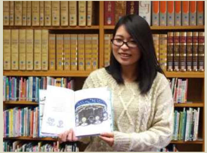
絵本・ブックトーク 私のお気に入りをおみんなに