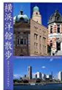
5月「もっと知りたい、横浜のこと」